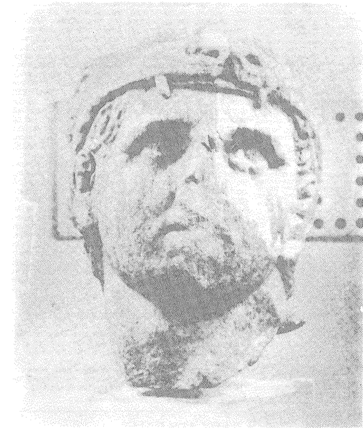
Κεφαλή του Τηλέφου, από το Δυτικόν αέτωμα του ναού της Αλέας Αθηνάς, έργον του Σκόπα. Ως υιός του Ηρακλέους, φέρει δέρμα λέοντος εις την κεφαλήν, ως και ο άλλος Ηρακλείδης, ο Μ. Αλέξανδρος. Ο Τήλεφος, κατά την μυθολογίαν, ήτο υιός του Ηρακλέους και της Αύγης, θυγατρός του βασιλεώς της Τεγέας Αλεού. Κατά μίαν παραλλαγήν του μύθου, επειδή εγεννήθη εκτός γάμου εγκαταλείφθη υπό της μητρός του εις το Παρθένιον όρος της Αρκαδίας, όπου επέζησε θηλάζων έλαφον. Κατ' άλλην παραλλαγήν εκλείσθη υπό του Αλεού εις μίαν κιβωτόν η οποία εξεβράσθη εις την Μυσίαν, ένθα επληρώθη εις μάχην μετά του Αχιλλέως. Χρησμός τις υπέδειξε τον τρόπον θεραπείας δια του "ο τρώσας και ιάσεται". Εις αντάλλαγμα ο Τήλεφος προσέφερθη να οδηγήσει τους Έλληνας εις την Τροίαν. Η κεφαλή εκλάπη μετά πολλών άλλων ευρημάτων κατά τας αρχάς Αυγούστου 1992 εκ του Μουσείου της Τεγέας.

Τ' αγάλματα στο Μουσείο της Τεγέας τουρτουρίζοντας τυλίγουν σφιχτά τους μανδύες. Αυξήθηκαν οι ρυτίδες των προσώπων τους. Οι τέσσερις μήνες της απουσίας σου άφησαν πάνω τους σημάδια γήρατος αιώνων. Κλεφτά κυτιάνε πίσω από το ραγισμένο τζάμι τα αγάλματα - παρέες του υπόστεγου, ελπίζοντας πως δε θα δούνε γυμνό το θάβρο σου. Μια επιτύμβια στήλη γνέφει λυπημένα την άρνηση και το λιμνασμένο νερό στις γούβες των κιόνων γίνεται αρμυρό. Μέσα στην αίθουσα, ακέφαλα κορμιά, θρυμματισμένα χαμόγελα, τεντωμένες κνήμες χωρίς βήματα, δάχτυλα ακινητοποιημένα - όλα στραμμένα προς το κενό σου - σαν να νιώθουν για πρώτη φορά την τραγικότητα της αποσπασματικότητάς τους. Του Ηρακλή - πατέρα σου, δίπλα, το βλέμμα παραέγινε απλάνες αυτοτυφλώθηκε τη μέρα που στάθηκε αδύναμος να πνίξει τα χέρια - φιδία που σε απήγαγαν από την αντικρυνή πόρτα. Οι δύο Νίκες που σε παράστεκαν, αρνιούνται να πετάξουν ανυδρών βία στο άγγιγμα αυτών που ψηλαφούν τους κυματισμούς των πτυχώσεων και συμπεραί-