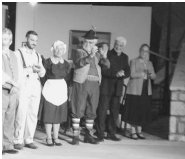
Ο θίασος του Πολιτιστικού Συλλόγου «Απόλλων» Περιγιαλίου