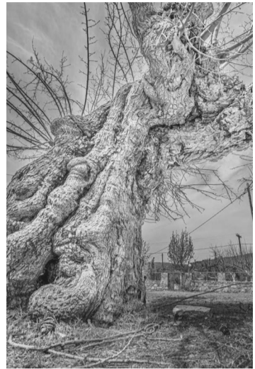
Η μουριά του Παπαφλέσσα, Πολιανή Μεσσηνίας

πόννησο. Η μουριά, δέντρο ιδιαίτερα ανθεκτικό, φυλλοβόλο, μακρόβιο με πλούσια σκιά και μεγάλα γυαλιστερά, πράσινα φύλλα, χρησιμοποιείται