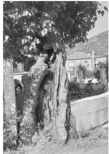
Η μουριά μας στα Σαντικαίικα, Κανδύλα Αρκαδίας

Στέκεται εκεί, να μας θυμίζει με το πρασίνισμα την Άνοιξη και το φθινόπωρο το κιτρίνισμα των φύλλων της, την εναλλαγή των εποχών. Άντε-