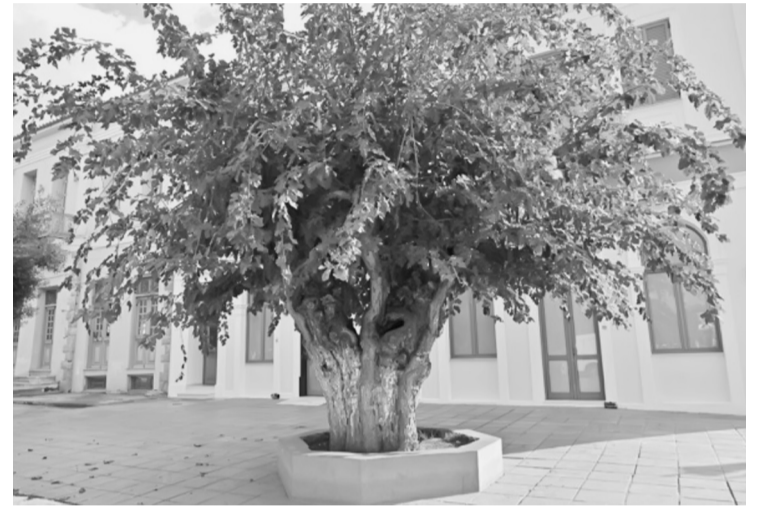
Η μουριά Ταμβάκη, Φιλατρά Μεσσηνίας ΠΗΓΗ: https://www.archaiologia.gr/blog/photo

Αντιγράφω, ως επίλογο από τον ιστότοπο της πρωτοβουλίας: «Τα αιωνόβια δέντρα αποτελούν διαχρονικά σύμβολο