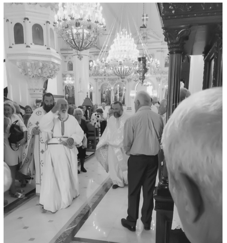
Ο Σεβασμιώτατος κατά τα εγκαίνια