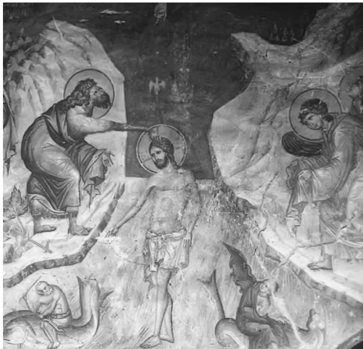
Πανσέληνος Μανουήλ, Πρωτάτο Αγίου Όρους (13ος αι.)