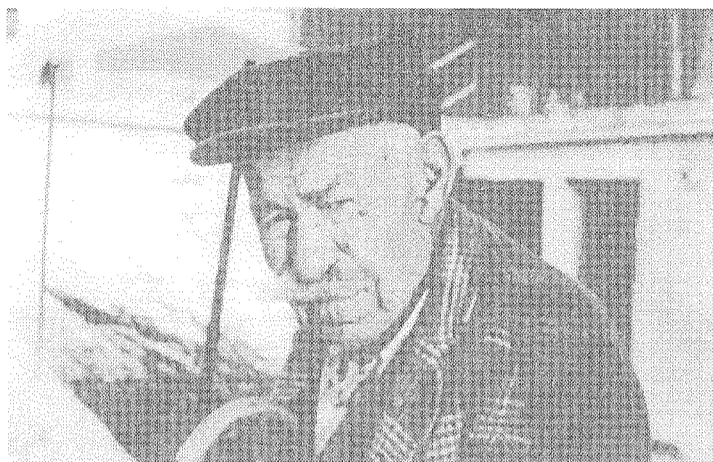
(Ε. Β. Μερκούρης) «Ο Γέρος»