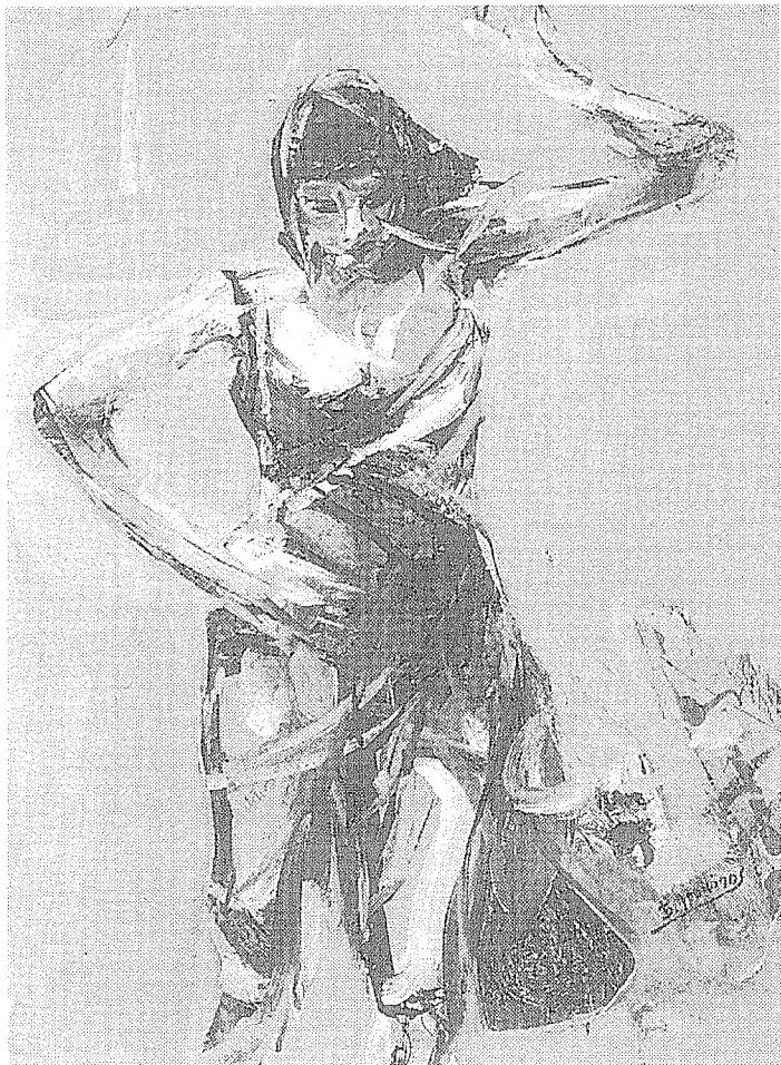
Βασίλης Προκόπος: Λάδι 60x80 εκ. (Από την Έκθεση Φεβρουαρίου 1998)

συστηματικά με τη ζωγραφική το 1982 με δάσκαλο το Θεόδωρο Πάντο. Συμμετείχε στην καλλιτεχνική ομάδα ΣΥΝ σε όλες τις δραστηριότητές της (ομαδικές εκθέσεις, περιοδικό, εκδηλώσεις) και έχει πάρει μέρος σε πολλές ομαδικές εκθέσεις στην Ελλάδα και στο εξωτερικό.