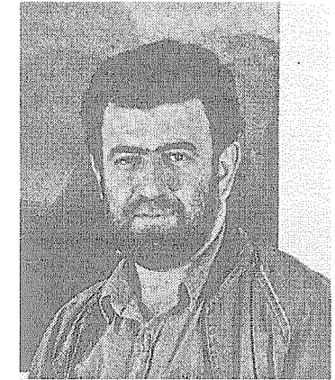
Ο ζωγράφος Βασίλης Προκόπος μπροστά σε έργα τέχνης εμπνευσμένα από την Αρκαδία.

Ο zωγράφος Βασίλης Προκόπος ανέφερε γι' αυτή την έκθεση, που εγκαινίασε ο δήμαρχος Μαντινείας Γιώργος Τσαγγούρης, «μέσα από αυτή τη διαδοχική πορεία, αυθόρμητα και συνειρμικά άρχισαν να προβάλλονται στους πίνακες μου εικόνες - σύμβολα. Νύμ-