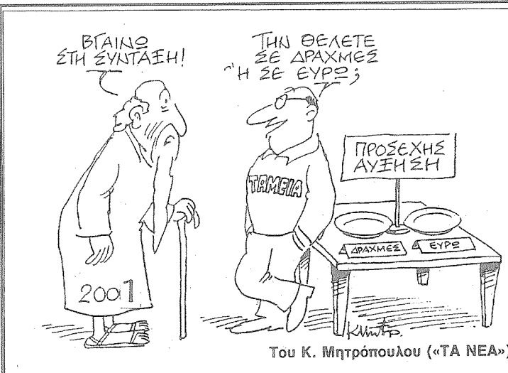
Του Κ. Μητρόπουλου («ΤΑ ΝΕΑ»)