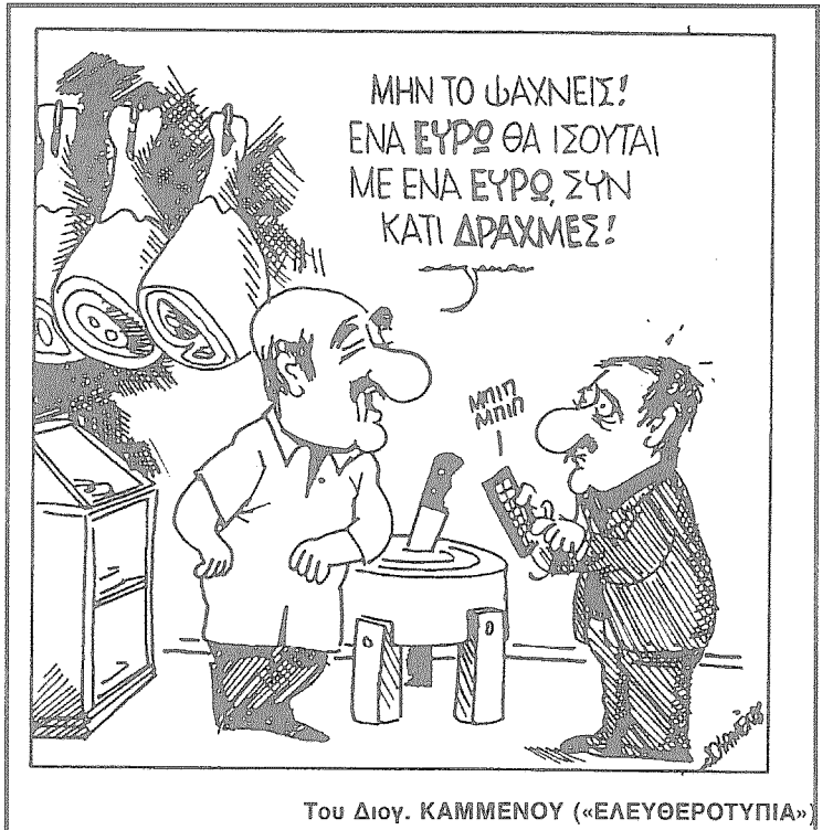
Του Διογ. ΚΑΜΜΕΝΟΥ («ΕΛΕΥΘΕΡΟΤΥΠΙΑ»)

ή του παπά το χωράφι, για τα ξύλα, για να είμαστε πίσω πριν το μεσημέρι γιατί μας περίμεναν σωρό άλλες δουλειές.