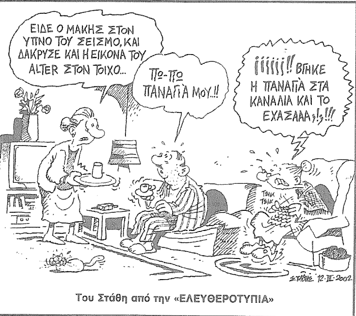
Του Στάθη από την «ΕΛΕΥΘΕΡΟΤΥΠΙΑ»