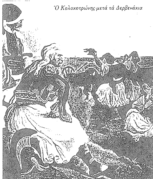
‘Ο Κολοκοτρώνης μετά τά Δερβενάκια

όλες τες γλώσσες του κόσμου, οι οποίοι, μολονότι όπου και αν εύρισκαν εναντιότητες, και οι βασιλείς και οι τύραννοι τους κατέρρεχαν, δεν ημπούσε κανένας να τους κάμει τίποτα. Αυτοί εστερέωσαν την πίστη...»