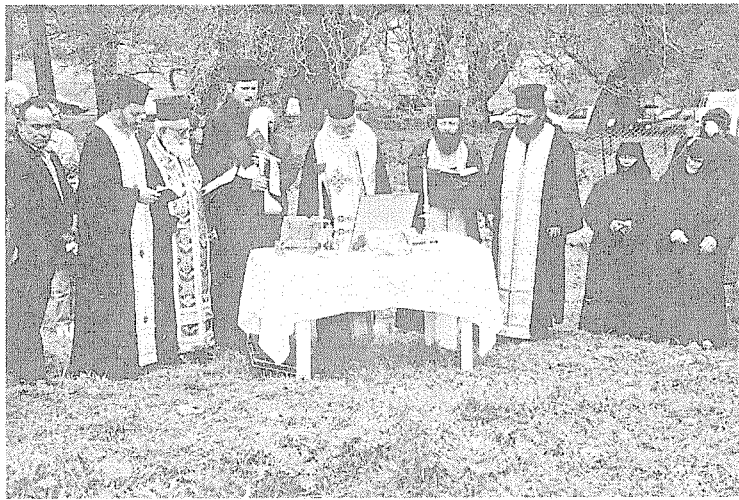
Από τα εγκαίνια του Ιερού Ναού της Αγίας Παρασκευής στο Σίντζι.

όψη, ο χώρος ιτιές - πλάτανος και ο γύρω χώρος θα διευρυνθεί, θα γίνει ενιαίος, θα αναδιαμορφωθεί, θα γίνει πιο άνετος, πιο ευρύχωρος και διατους ανθρώπους που τον κατακλύζουν αλλά και δια τ' αμάξια τους, κατά τις ημέρες κυρίως της πρωτομαγιάς, της Αγίας Τριάδας και τώρα θα προστεθεί και ακόμη μια ημέρα διαπανηγύρι στον χώρο αυτό, της Αγίας Παρασκευής. Ο ιδανικός