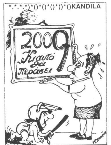
Του Διογένη Καρένου από την «Ελευθεροτυπία»