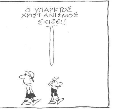
Του Κώστα Μητρόπουλου από «τα Νέα»