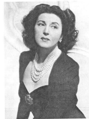
Η μεγάλη τραγωδός μας Κατίνα Παξινού

Αλλά το όμορφο αυτό αρκαδικό χωριό μας έδωσε τη μεγαλύτερη μορφή του ελληνικού θεάτρου, που ανίστησε το αρχαίο ελληνικό πνεύ-