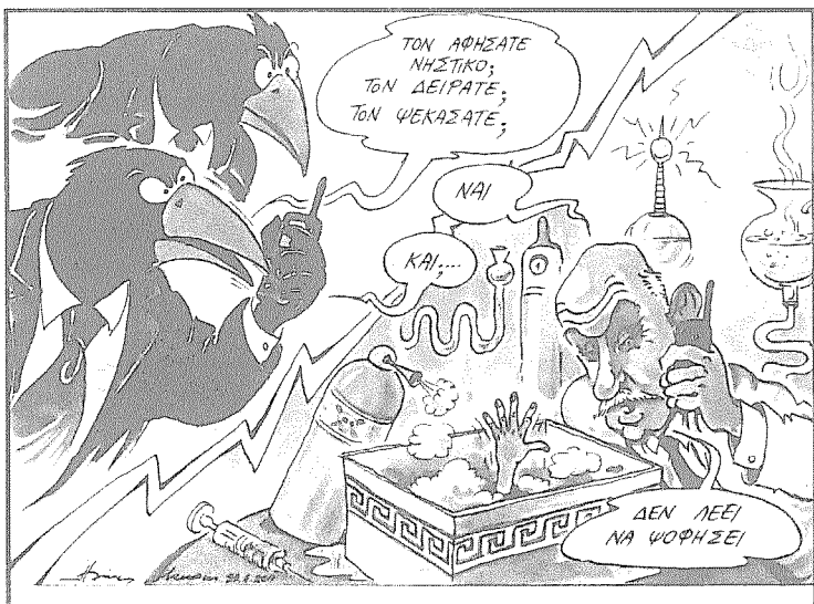
Από την «ΚΑΘΗΜΕΡΙΝΗ» του Ηλία Μακρή