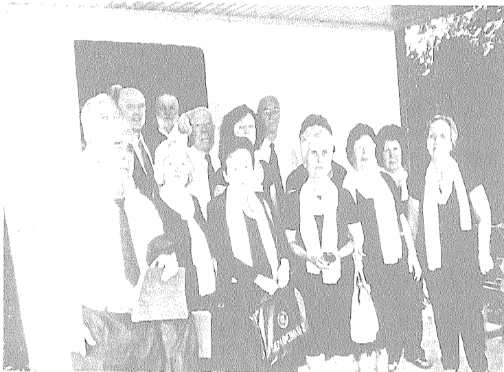
Η χορωδία του Πολιτιστικού Συλλόγου Άσου «ΡΕΑ» στον Άγιο Ανδρέα

Όμως πιο ενθουσιασμένοι έφυγαν οι 50 και πλέον προσκυνητές του Συλλόγου «ΗΡΕΑ» με τους Χορωδούς, οι οποίοι ομολόγησαν ότι τέτοια φιλοτιμία και φιλοξενία παράλληλα δεν την περίμεναν, οι οποίοι και εξεπλάγησαν ακόμη περισσότερο, όταν μετά την επιστροφή από την επίσκεψη στο Μοναστήρι δέχτηκαν κέρασμα στο καφενείο του Στέλιου Μερκούρη από τον Πρόεδρο του Συλλό-