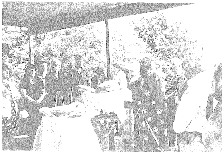
Στο υπόστεγο έξω από το ναό η αρτοκλασία

αρτοκλασίας. Το παραδοσιακό λουκουμάκι. Το τσίπουρο και προ πάντων το βραστό με τις χυλοπίτες έδωσαν μια άλλη διάσταση φιλοξενίας και φιλότιμου