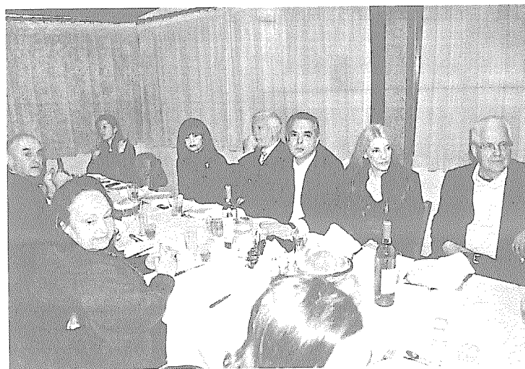
Ο Περιφερειάρχης Πελοποννήσου Πέτρος Τατούλης και η παρέα του